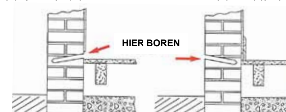
afb. D: Buitenkant