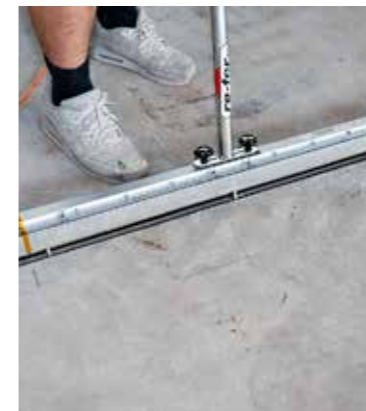
4 Activeren «verwarmen van re-bar Infrarood-warmtestraler re-IR 1500

> Activeer «Verwarming» met infrarood stralingsverwarming (variant re-EL-verwarming)