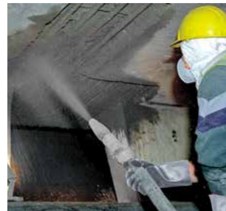
5B Sika MonoTop-422 PCC aanbrengen tussen de eindbevestigingen