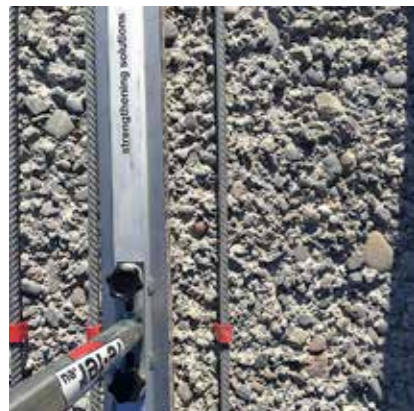
4 Activeren van de re-bar met Infraroodstraler re-IR 1500

> Activeer «Verwarming» met infraroodstraler of variant re-EL-verwarmingssysteem