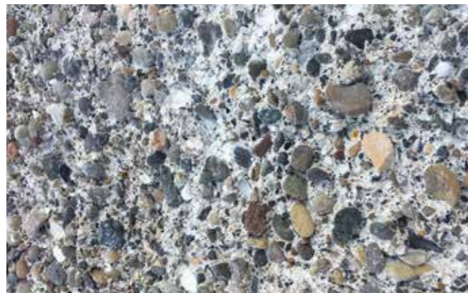
1 Hydromechanisch opruwen van de beton ondergrond