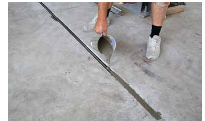
5 Aanbrengen van SikaGrout-311 rondom de re-bar, tussen de eindbevestigingen.