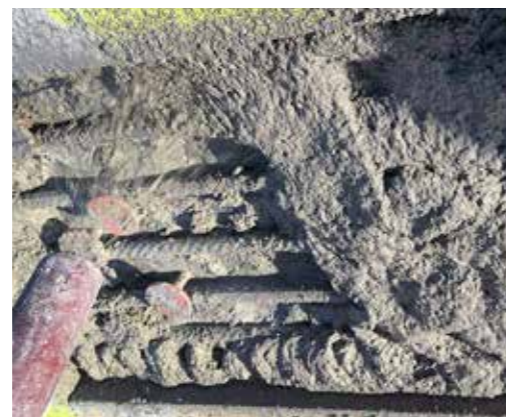
3B Inbedding aan beide zijden in Sika MonoTop-422 PCC «gespoten mortel» als eindverankering"