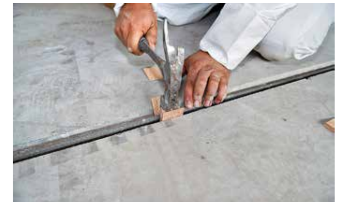
2 re-bar centraal vastzetten in betongroef

> Eindverankering aan beide zijden in Sika Grout 300 mm