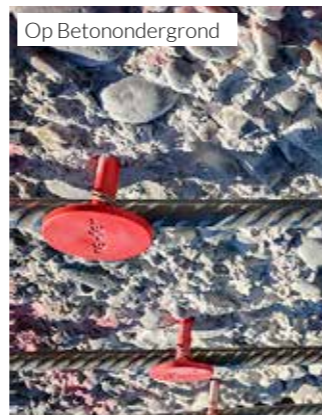
2 Bevestiging re-bar met elektrische isolatoren re-clip en/of re-bolt