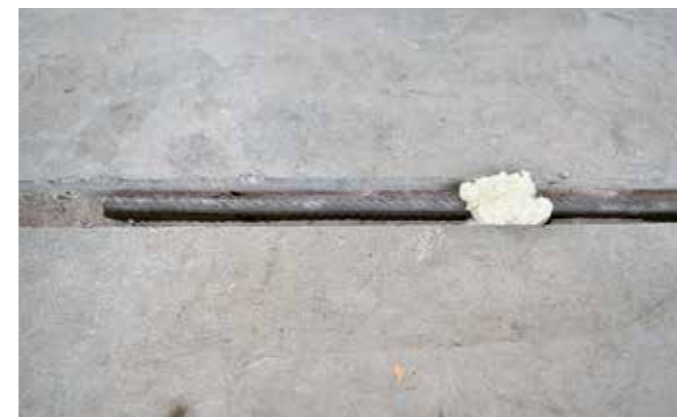
3 Aan beide zijden inbedden in SikaGrout-311

> Eindverankering aan beide zijden in Sika Grout 300 mm