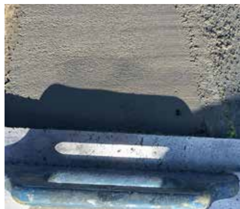
3A Inbedding aan beide zijden in Sika MonoTop 452 N «Herprofilermortel» als eindverankering

> Eindverankering aan beide zijden in Sika MonoTop 500 mm