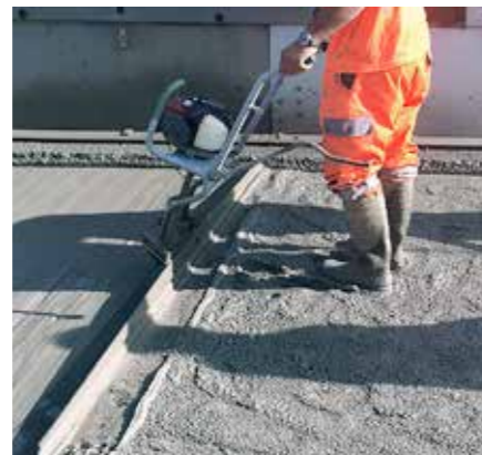
5A Sika MonoTop-452 N aanbrengen tussen de eindbevestigingen